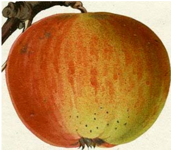
Vue Annales de pomologie belges et étrangères.